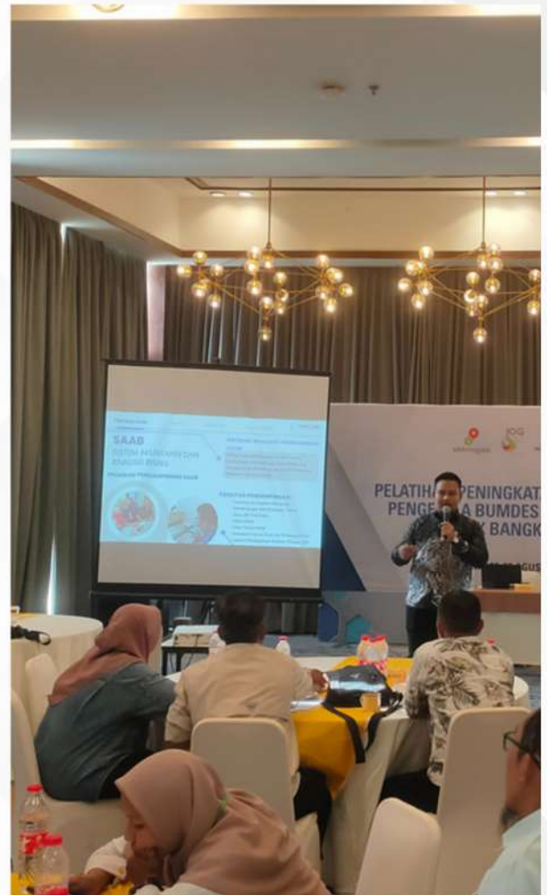
• Dokumentasi Pelatihan Peningkatan Kapasitas Pengelola BUMDes Di Wilayah Blok Bangkanai

Mereka diterbangkan dari Kalimantan Tengah ke Surabaya di Jawa Timur untuk mengikuti pelatihan in-class selama 2 hari kerja dengan materi-materi penguatan kelembagaan dan pengembangan usaha BUM Desa dari tenaga ahli Bumdes.id serta diakhiri dengan kunjungan lapangan selama 1 hari ke Desa Sanankerto.