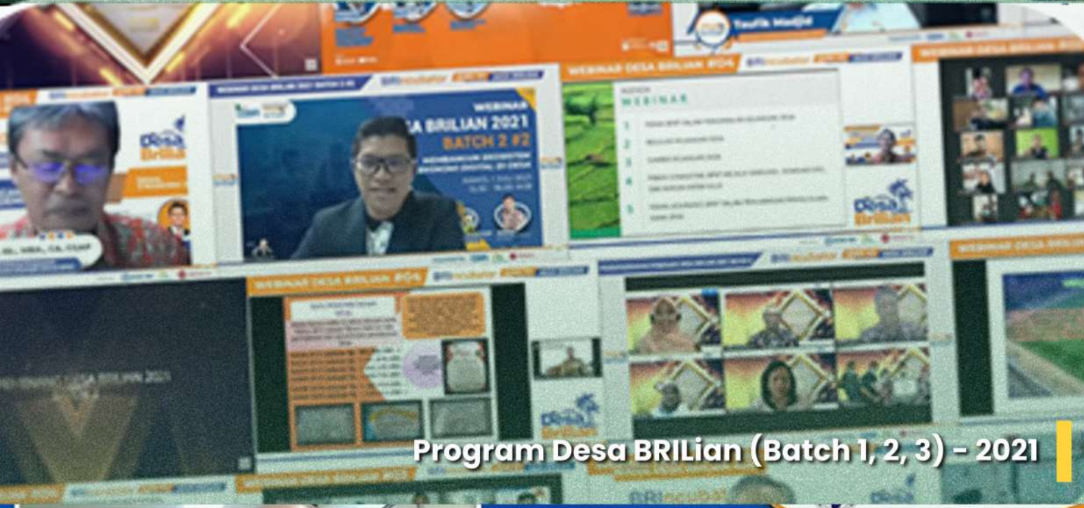
Program Desa BRILian (Batch 1, 2, 3) - 2021