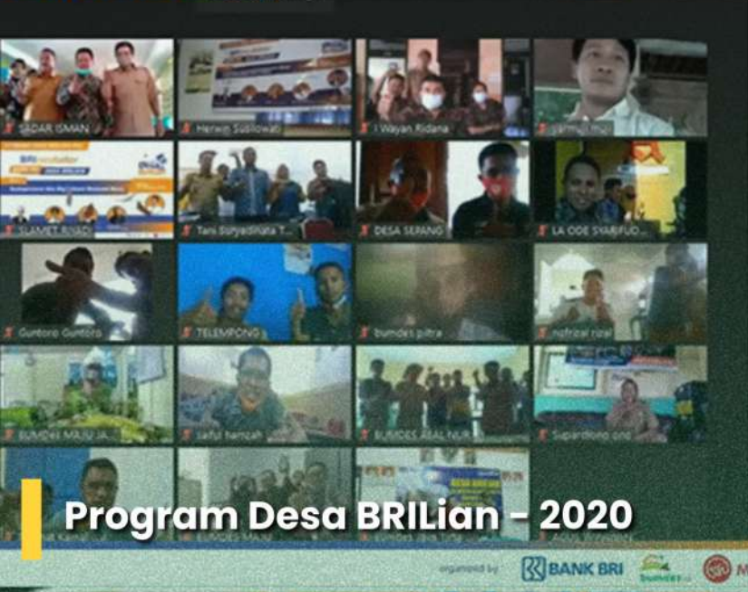
Program Desa BRILian - 2020