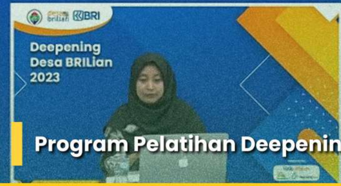
Program Pelatihan Deepening Desa BRILian - 2023