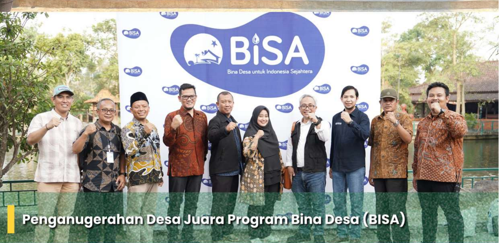
Penganugerahan Desa Juara Program Bina Desa (BISA)