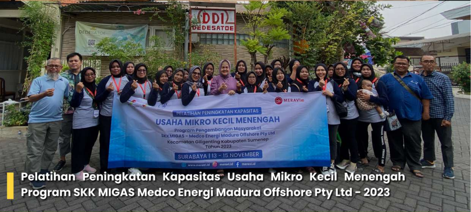
Pelatihan Peningkatan Kapasitas Usaha Mikro Kecil Menengah Program SKK MIGAS Medco Energi Madura Offshore Pty Ltd - 2023