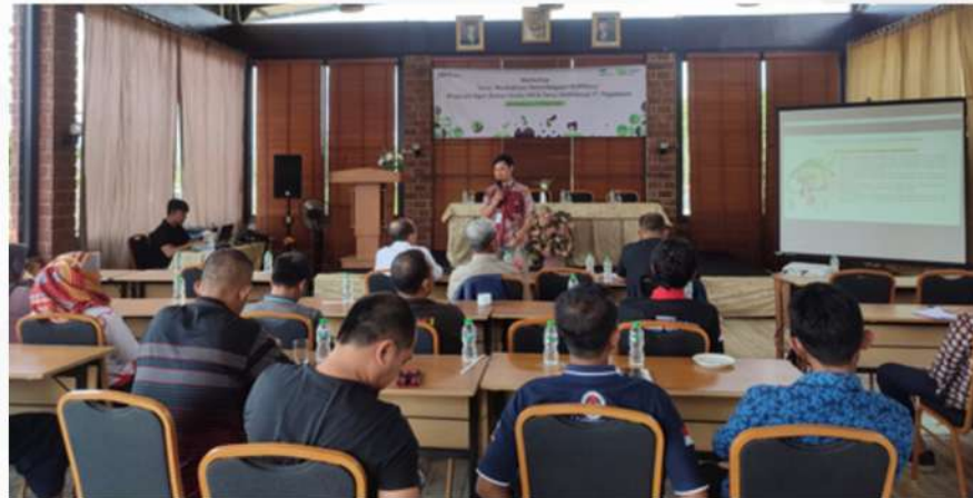
• Workshop Tema "Revitalisasi Kelembagaan BUMDesa" Program Agen Badan Usaha Milik Desa (BUMDesa) PT. Pegadaian

PT. Pegadaian (Persero) badan usaha milik negara yang berfokus pada layanan pemberian pinjaman dengan jaminan barang bergerak baik dengan sistem konvensional dan syariah memiliki program akuisisi untuk melahirkan agen pegadaian BUMDes di pedesaan, salah satu program diluncurkan di Kabupaten Sumedang Jawa Barat.